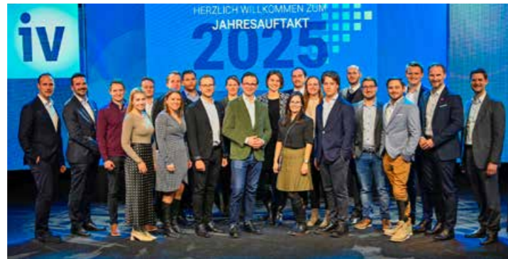
Neujahrsaftakt 2025 der IV Kärnten