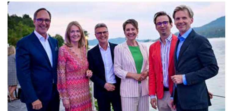
Mut und Reformen waren das Thema beim Sommerempfang 2025